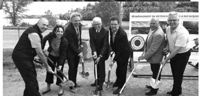
Le coup d'envoi des travaux sur la rue Jacques-Cartier a été donné le 6 juin dernier.