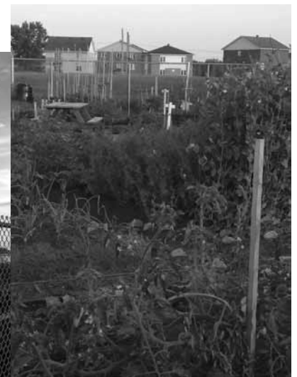
Le jardin communautaire Tecumseh est situé au 280, chemin de la Savane.