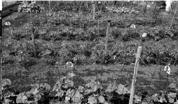
Le jardin des Petites Sœurs est situé au 1, rue Rodolphe.