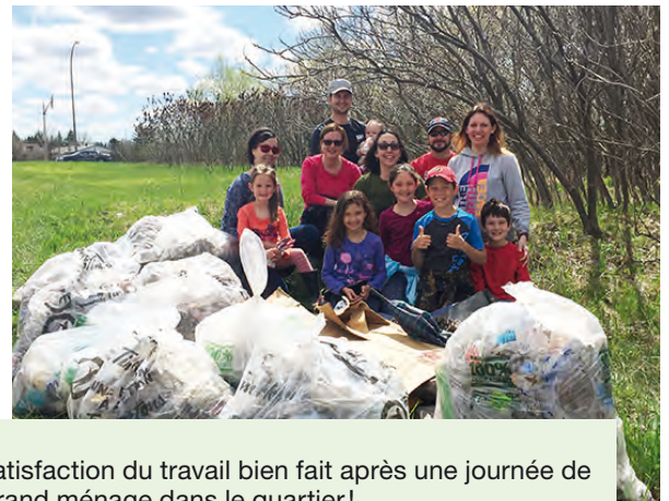
Satisfaction du travail bien fait après une journée de Grand ménage dans le quartier!

Le 7 mai dernier, une quinzaine de citoyennes et citoyens du quartier ont pris part au Grand ménage de Gatineau. Cette première opération nettoyage, organisée en collaboration avec l'Association citoyenne de Pointe-Gatineau, fut un succès. Le secteur de la rue Louis-Riel et du boulevard Gréber a été passé au peigne fin, dont l'arrêt d'autobus de la Société de transport de l'Outaouais (STO). Bravo à tous les bénévoles! Avis aux intéressés, la Ville organise un autre grand ménage cet automne où il sera encore une fois possible pour les citoyens d'organiser des corvées dans leur quartier.